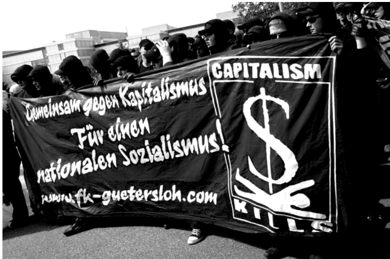
“Nacionalistas autónomos” (Por favor, que alguien saque a estos idiotas de nuestras miserias!)

Incluso los fascistas intentan entrar en esto de la descentralización y la autonomía. En Europa, los “Nazionalistas Autónomos” se han apropiado de la estética y los formatos radicales, utilizando una retórica anticapitalista y tácticas de Black Bloc . No es simplemente una cuestión de que nuestros enemigos intenten disfrazarse de nosotros, aunque ciertamente embarra las aguas: también denota un cisma ideológico en los círculos fascistas en tanto que la generación más joven intenta actualizar sus modelos organizativos para el siglo XXI. Los fascistas en los EE.UU. y en otras partes están involucrados en el mismo proyecto bajo el paradójico título de “Anarquismo nacionalista”; si tienen éxito en convencer a la opinión pública de que el anarquismo es una forma de fascismo, nuestras perspectivas de verdad estarán complicadas.